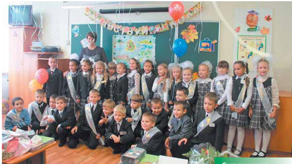
Семья и школа

В 1755 году в день памяти святой Татианы был основан Московский университет. Впоследствии Татьянин день стал отмечаться как праздник всех студентов. А в 2005 г., в год 250-летия МГУ им. Ломоносова, 25 января был официально объявлен Днем российского студенчества. С праздником дорогие ребята! Успеха и удачи в покорении вершин знаний!