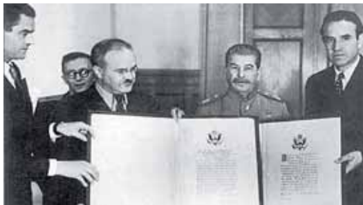
Посол США А. Гарриман передает грамоты президента Ф. Рузвельта Ленинграду и Сталинграду. 1944 г.

Я надеюсь, что, преподнося эти грамоты этим двум городам, Вы сочтете возможным передать их гражданам мое личное выражение дружбы и восхищения и мою надежду, что наши народы будут и дальше развивать то глубокое взаимопонимание, которое отметили наши совместные усилия».