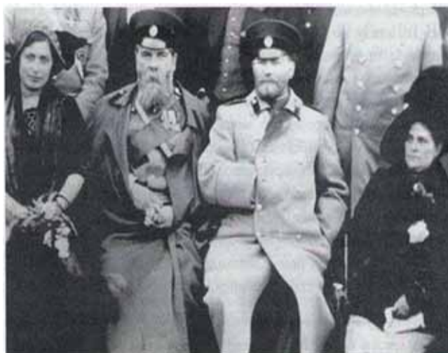
В.М. Бехтерев при закладке нового здания Психоневрологического института

ция должна была не только служить для целей отопления, вентиляции и освещения, но и снабжать горячей водой все здания больницы. От бесперебойной работы центральной станции зависела работа медицинского обо-