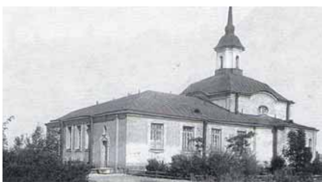
Здание бывшей часовни при больнице. Фото 30-х годов

ция должна была не только служить для целей отопления, вентиляции и освещения, но и снабжать горячей водой все здания больницы. От бесперебойной работы центральной станции зависела работа медицинского обо-