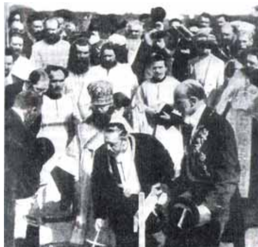
Епископ Гдовский Высокопреосвященный Венямин освящает место строительства больницы Петра Великого

падной части больницы территории. Недалеко от главного входа в больницу находилась квартира главного врача – двухэтажное здание, которое удачно сообщалось с главным и служебным въездами. Планировалось построить здания для проживания старших врачей, управляющего аптекой, священника и смотрителя, а также для проживания семей младшего медицинского персонала. Генеральный план больницы был тщательно разработан. По архитектуре, внутреннему устройству зданий, оборудованию и оснащению больницы имени Петра Великого должна была встать в один ряд с лучшими больницами Западной Европы.