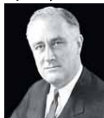
Франклин Д. Рузвельт – 32-й президент США (1933–1945 гг.)

Грамота была вручена И.В. Сталину 26 июня 1944 года вместе с письмом, в котором Рузвельт писал: